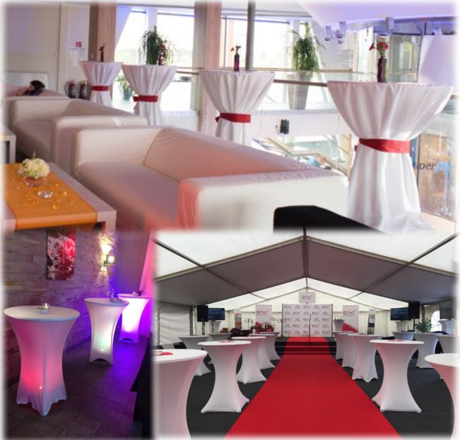
Okrúhly stôl 180cm s bielym obrusom